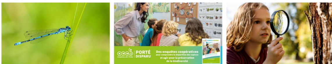
Calendrier de l'action Sciences coop'